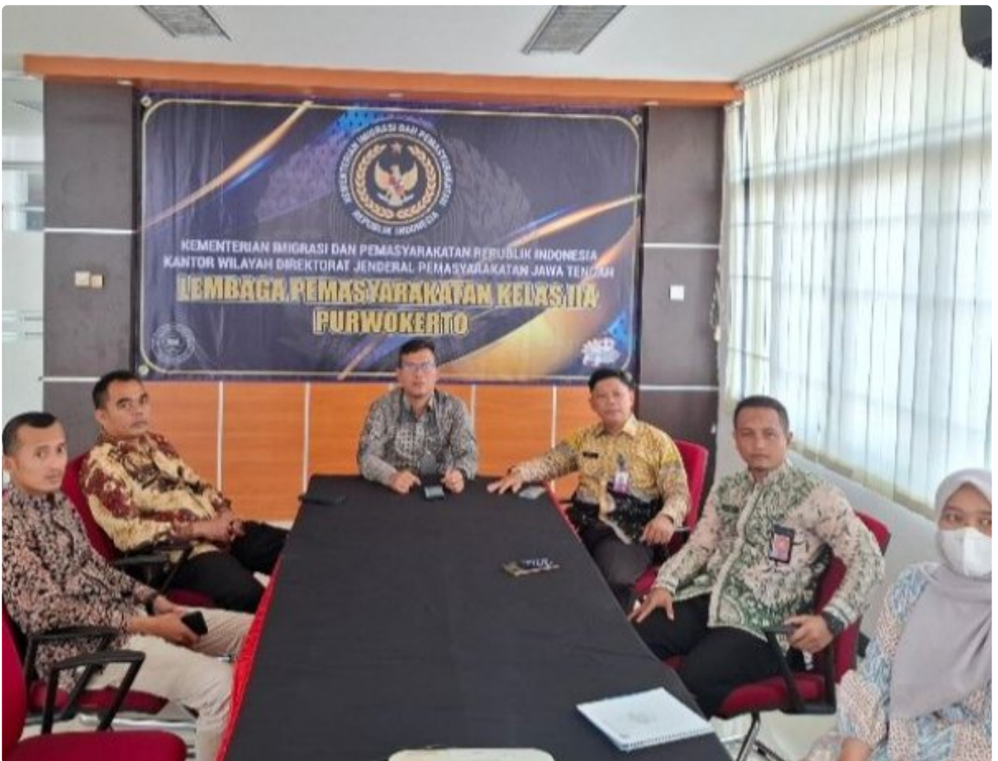
Lapas Kelas IIA Purwokerto Ikuti Entry Meeting Pemeriksaan BPK RI Atas Laporan Keuangan Kementerian Hukum dan HAM Tahun 2024 secara Virtual

PURWOKERTO - Lembaga Pemasyarakatan (Lapas) Kelas IIA Purwokerto